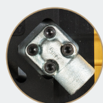
W = Raccordi 45° Fittings 45°